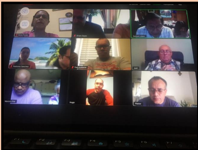
Reunión del Comité Ejecutivo CIES.