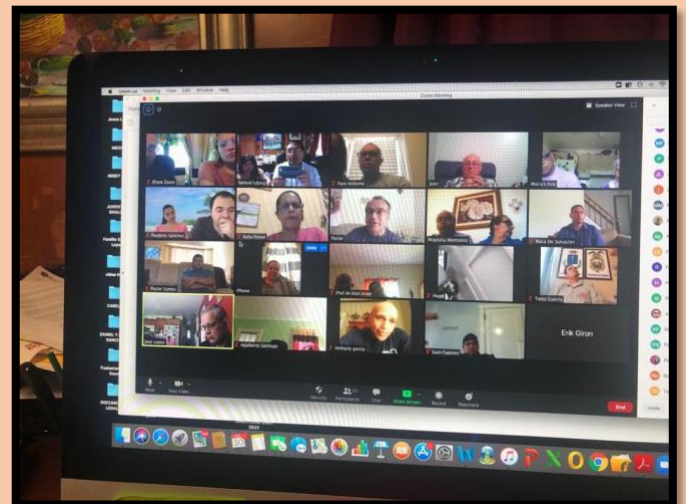
Reunión pastoral CIES.